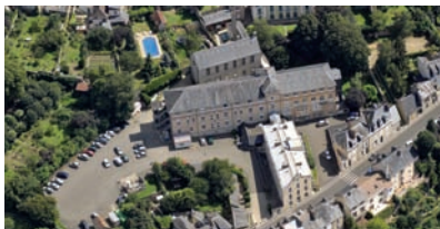
Centre de Soins de Suite Service de Soins Infirmiers A Domicile Le Mans