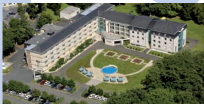
Centre Médical Foyer d'Accueil Médicalisé Service de Soins Infirmiers A Domicile Le Grand Lucé

Le Journal de la Fondation Georges Coulon