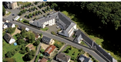
EHPAD Eugène Aujaleu Le Grand Lucé