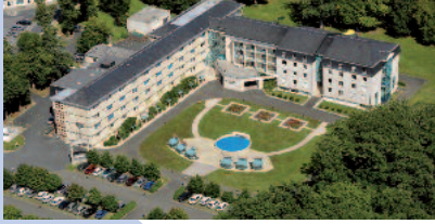
Centre Médical Foyer d'Accueil Médicalisé Service de Soins Infirmiers A Domicile Le Grand Lucé

Le Journal de la Fondation Georges Coulon